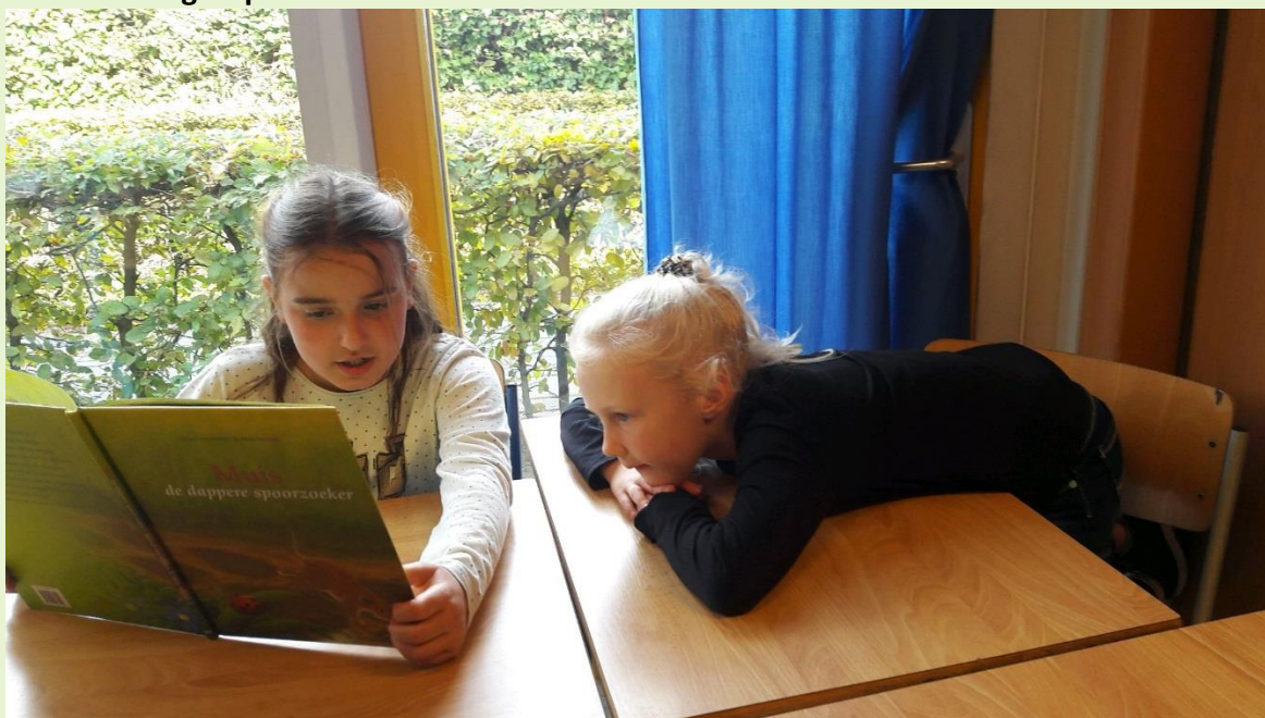
Groepsdoorbrekend lezen tijdens de Kinderboekenweek

Wilt u het bedrag van €25,- voor 31 oktober overmaken naar: NL36RABO0312212143 ten name van Primas-scholengroep/CBS De Kamperschouw onder vermelding van naam van uw kind en groep?